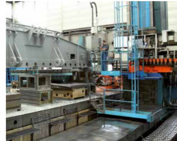
Skoda Plattenbohrwerk W 180 CNC